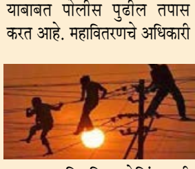
आपल्या नियमित चेकिंगसाठी मुलुंड पश्चिम येथील निर्मल लाईफ स्टाईलच्या शिरकोन को.

युनिटची तब्बल ६३.२३ लाखांची वीजचोरी झाल्याचे समोर आले आहे. याबाबत मुलुंड पोलीस ठाण्यात विद्युत कायदा २००३, कलम १३५ अन्वये निर्मल लाईफ स्टाईल व शिरकोन को. ऑप. हाऊसिंग सोसायटीवर गुन्हा दाखल करण्यात आला आहे (एफ.आय.आर-फि. स्था.ख.क्र.६७, वष.२०२१ दि.४.०६.२०२१).