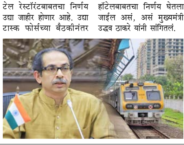
हॉटेलबाबतचा निर्णय घेतला जाईल असे, असं मुख्यमंत्री उद्धव ठाकरे यांनी सांगितलं.