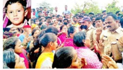
मोर्चाचे येऊन आपल्या संतप्त भावना व्यक्त केल्या. हा नरबळीचाच अशोरी प्रकार आहे. यातील

बळी गेल्याने संतापजनक प्रतिक्रिया उमटत आहेत. अशा अतिसंवेदनशील व भावनिक परिस्थितीत व कायद्याच्या चौकटीत राहून पोलिसांना तपास करावा लागत आहे. या खुनासंबंधी कोणतेच ठोस पुरावे व धागेदोरे पोलिसांच्या हाती नसल्यामुळे मोठ्या सत्त्वपरीक्षेला पोलिसांना सामोरे जावे लागणार आहे. तसेच जनतेच्या रोषालादेखील सामोरे जावे लागत आहे.