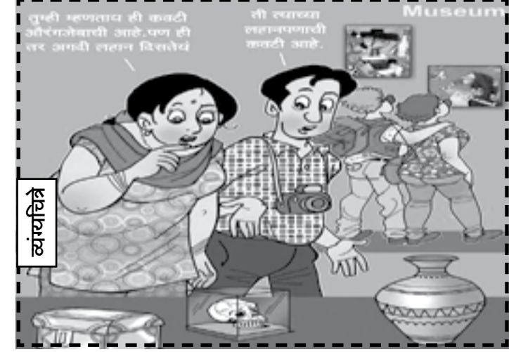
तुम्ही म्हणताना ही कावटी अतिरिक्तच वाचण्याची गरज आहे. पण ही तर अगदी लहान विद्यार्थी.