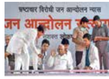
भ्रष्टाचार विरोधी जन आन्दोलन न्यास 'जन आन्दोलन' च्या सदस्यांनी अण्णा हजारे यांच्यासोबत गांधी चरित्र्याने निर्माण केलेल्या 'रोज मरे, त्याला कोण रडे' अशी अवस्था होते. रामलीला मैदानावर अण्णांच्या आंदोलनात जनता फार उत्साहाने उतरली नाही. वर्तमानपत्रांना नकारात्मक बातम्या हव्या असतात. आंदोलकांची उपस्थिती कमी याची बातमी सातत्याने दाखवली गेली.

नाही, तशी ती कमीदेखील झालेली नाही. लोकपाल विषयासाठी २०११ मध्ये त्यांनी असेच आंदोलन केले होते. तेव्हा सारा देश त्यांच्या मागे उभा राहिला. लोकांनी उत्स्फूर्तपणे चौकाचौकात सभा घेतल्या. त्यात तरुण मोठ्या संख्येने सामील झाले. देशाच्या नैतिक शक्तीचे हे जागरण होते. या उपोषणाच्या काळात २०११ चा प्रतिसाद अण्णांना लाभला नाही. एक तर नरेंद्र मोदी सरकारविरोधात भ्रष्टाचाराचा आरोप करता येईल, असे कोणतेही मोठे प्रकरण समोर आलेले नाही. नरेंद्र मोदी म्हणतात की, मी पैसा खात नाही आणि कोणाला खाऊ देणार नाही. सरकारचे व्यवहार जेवढे पारदर्शक करता येतील तेवढे करण्याचा त्यांनी प्रयत्न केलेला आहे. मोदी भ्रष्टाचारी आहेत, असे कोणी म्हणू शकत नाही. त्यामुळे जनतेच्या दृष्टीने भ्रष्टाचाराचा मुद्दा २०११ प्रमाणे ज्वलंत नव्हता. कोणतेही आंदोलन एकाच प्रश्नासाठी वारंवार करता येत नाही. पहिल्यांदा लोकांचा उत्साह असतो. नंतर त्याची पुनरावृत्ती होत राहिल्यास 'रोज मरे, त्याला कोण रडे' अशी अवस्था होते. रामलीला मैदानावर अण्णांच्या आंदोलनात जनता फार उत्साहाने उतरली नाही. वर्तमानपत्रांना नकारात्मक बातम्या हव्या असतात. आंदोलकांची उपस्थिती कमी याची बातमी सातत्याने दाखवली गेली.